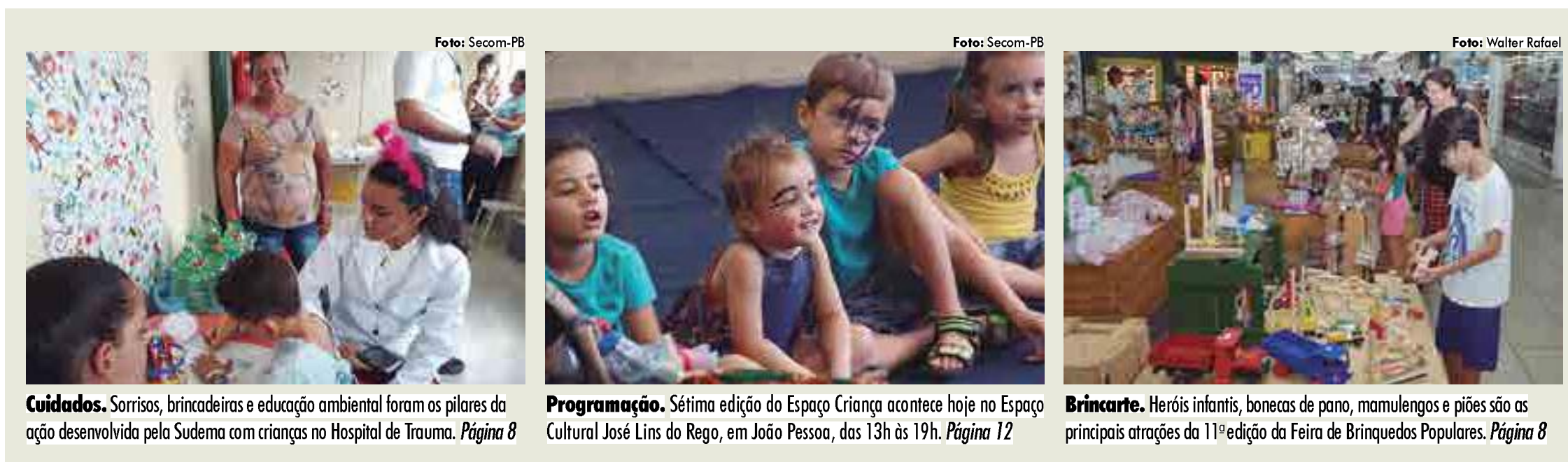
Cuidados. Sorrisos, brincadeiras e educação ambiental foram os pilares da ação desenvolvida pela Sudema com crianças no Hospital de Trauma. Página 8