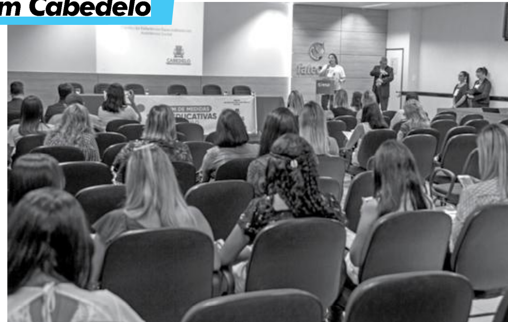
Evento debate, informa e busca meios de efetivar políticas públicas socioeducativas nos serviços de reinserção